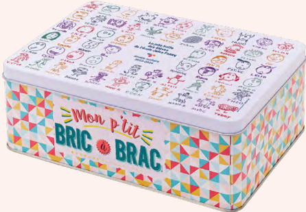
BRIC À BRAC